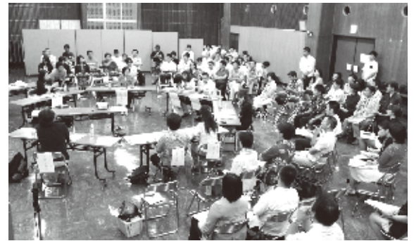
那覇での地域円卓会議の様子

沖縄では、「災害の停電時に介護家庭を支援する方法」「県産魚のブランディング」「地域のつなぎ手人材の育成」など、多種多様な課題についての地域円卓会議が開催されています。